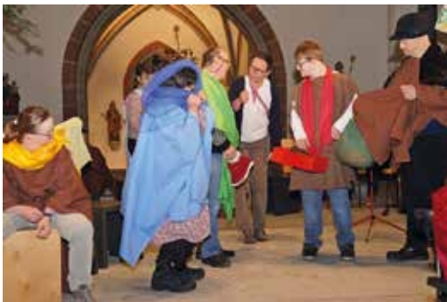
Krippenspiel der Stiftung ssb, 2023

Für Kinder, Jugendliche und Erwachsene mit einer Beeinträchtigung sind Kontakte zu Menschen ausserhalb der Institutionen, in denen sie leben, arbeiten oder zur Schule gehen, keine Selbstverständlichkeit, doch häufig ein Bedürfnis. Mit Angeboten wie zum Beispiel der Disco, die regelmässig stattfindet und Menschen mit und ohne Handicap ansprechen möchte, können Pfarreien, Kirchgemeinden und die Ökumenische Behindertenseelsorge einen Ort anbieten, wo grenzüberschreitend und barrierefrei Musik und Tanz genossen werden können.